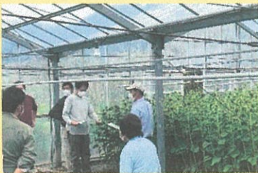
収穫時切り前目揃い会