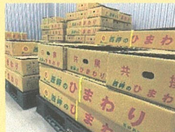
予冷庫を活用した品質維持