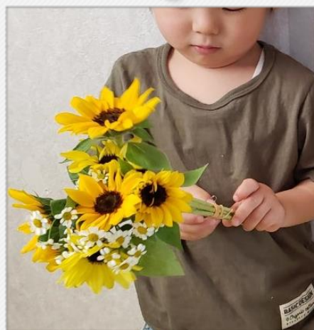
ぱぱ おしごとおかしさ？