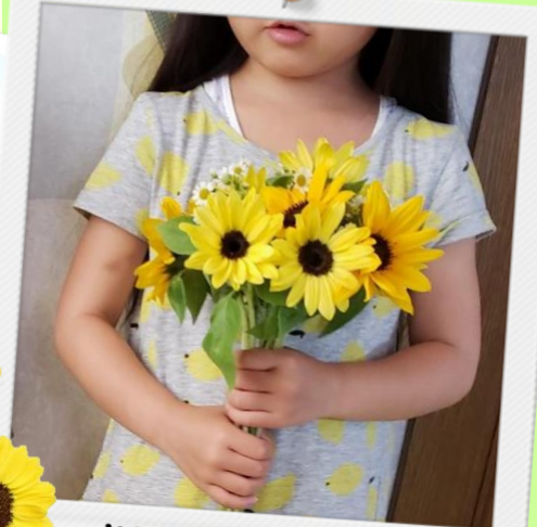
お父さん、ありがとう！

ひまわりの花言葉は「敬慕」 心から尊敬し慕うこと 家族のために一生懸命なお父さんへ！ 日頃の感謝の気持ちをひまわりと共に 贈ってみてはいかがでしょうか？