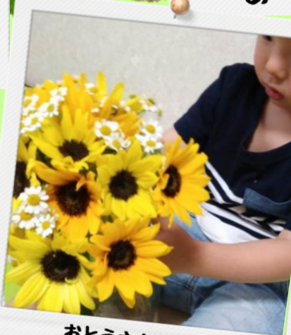
おとうさん はいっ、プレゼント