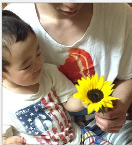
ぱぱ ひまわり どうぞ！

ひまわりの花言葉は「敬慕」 心から尊敬し慕うこと 家族のために一生懸命なお父さんへ！ 日頃の感謝の気持ちをひまわりと共に 贈ってみてはいかがでしょうか？