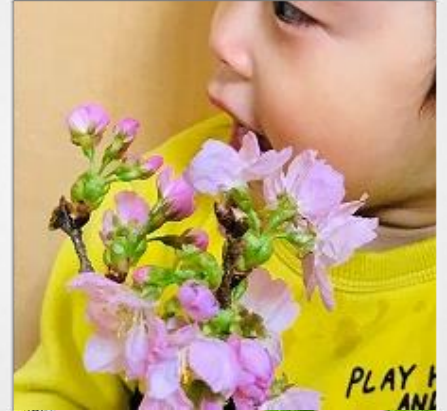
おにいちゃん おねえちゃん・おめでと!