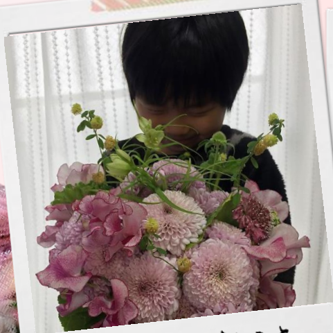
いい香りがするよ

だから今年は、おうちでお花を楽しみましょう！ 春は花の種類も豊富♪好みの色や香りの花を飾って、 笑顔の花を咲かせましょう!!