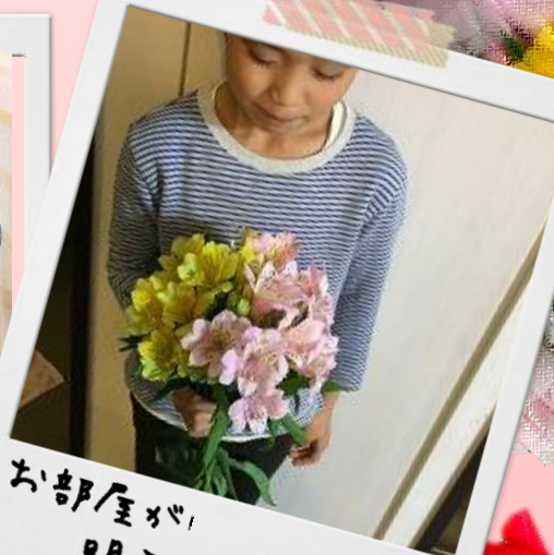
お部屋が 明るくなりそう