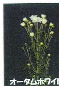
オータムホワイト

9月彼岸出荷向けの白色品種で、分枝数、花蕾数が多いです。ボリューム感に富む頂点咲きです。