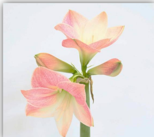
アップルブロッサム