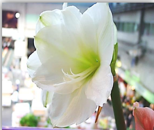
クリスマスギフト