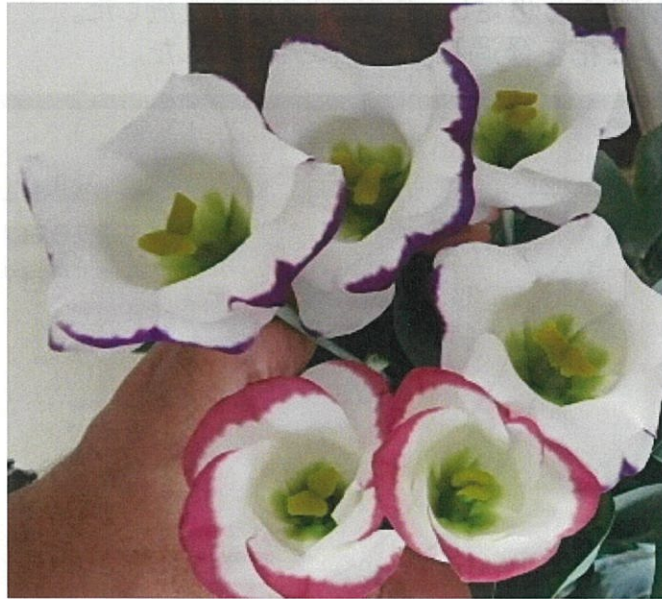
写真上:無花粉タイプ ブルーピコティー、下:同 ピンクピコティー