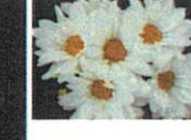
常陸 サマースノウ