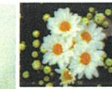
常陸 サマーシルキー