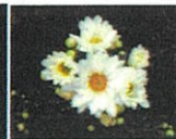
常陸 サニーホワイト

7月上旬出荷向けの純白に近い花色の品種です。ボリューム感のあるまとまった頂点咲きです。