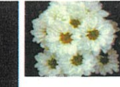
常陸 オータム パール