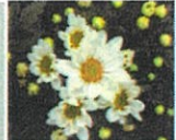
常陸 サニーパニラ

7月東京盆出荷向けの純白の品種で、市場性の高い緑芯の花です。頂点咲きで花数多く、草丈も長くボリュームがあります。